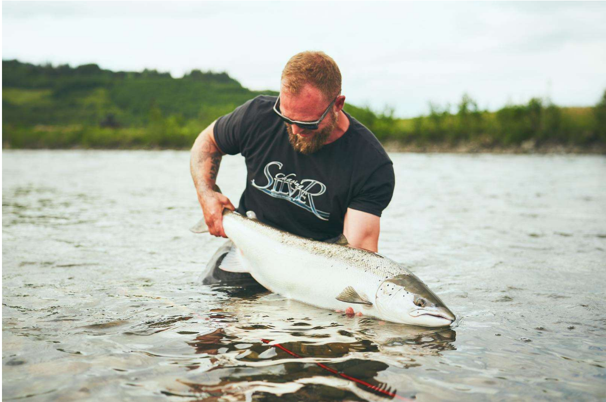
Roar mit seinem Lachs vom Beat E2.

Die neue Woche begann so erfolgreich wie die letzte geendet hat. Schon am Montagmorgen waren drei weitere Fische zwischen 79 und 95 cm im Fangbuch registriert. Diese Fische präsentieren wir Ihnen dann in unserem nächsten Update.