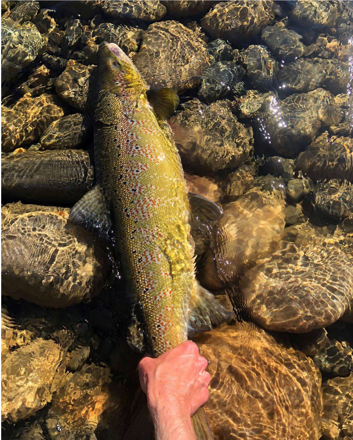
Thies mit dem letzten Fisch der Saison 2022 von den NFC Strecken an der Gaula.

Die erfolgreiche Saison an der Gaula ist gerade erst vorbei, aber wenn Sie in der kommenden Saison an der Gaula fischen möchten, dann ist es jetzt an der Zeit sich bei uns zu melden. Durch die sehr gute Saison 2022 sind einige Wochen jetzt schon so gut wie ausgebucht. Wenn Sie also eine der begehrten Ruten an den NFC Strecken an der Gaula haben möchten, dann müssen Sie sich beeilen. Schicken Sie uns einfach eine E-Mail, evtl. mit Ihrem Terminwunsch, an info@internationalflyfishersclub.com , oder kontaktieren Sie uns telefonisch unter der 0049 (0) 40 589 23 02.